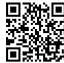
【ウルトラマンタロウ】 変身シーン集

電気工事会社で行う仕事は、調査から施工、アフターまで多岐に渡りますが、その中でも重要な業務に現地調査があります。調査時は、実際に施工時のイメージを絵で書き、写真も撮って帰ります。今はスマホがあるのも手軽に写真を撮る事ができますが、平面で切り取られた写真とは場所が撮っているのか分からなくなる事があります。 そこで電建が導入しているのが360度カメラです。このカメラは、シャッターを押せば上下左右全ての画像を撮る事ができます。その写真はスマホを動かす事で視点を変えながら見る事も出来ます。像度の高い平面の写真と合わせて撮影すれば、現地に写っているものも周囲の状況が手に取るように分かります。 以前、屋上で写真を撮る際に、頭上高く手を伸ばして写真を撮っていた姿を見て、変身するの（笑）かと思われたことがあり（笑）ました。 言われてみれば、ウルトラマンタロウの変身ポーズにしか見えません。 今の所このカメラに変身機能は備わっていませんが、『変身はできません』という記載がないので、次回試してみようと思います。